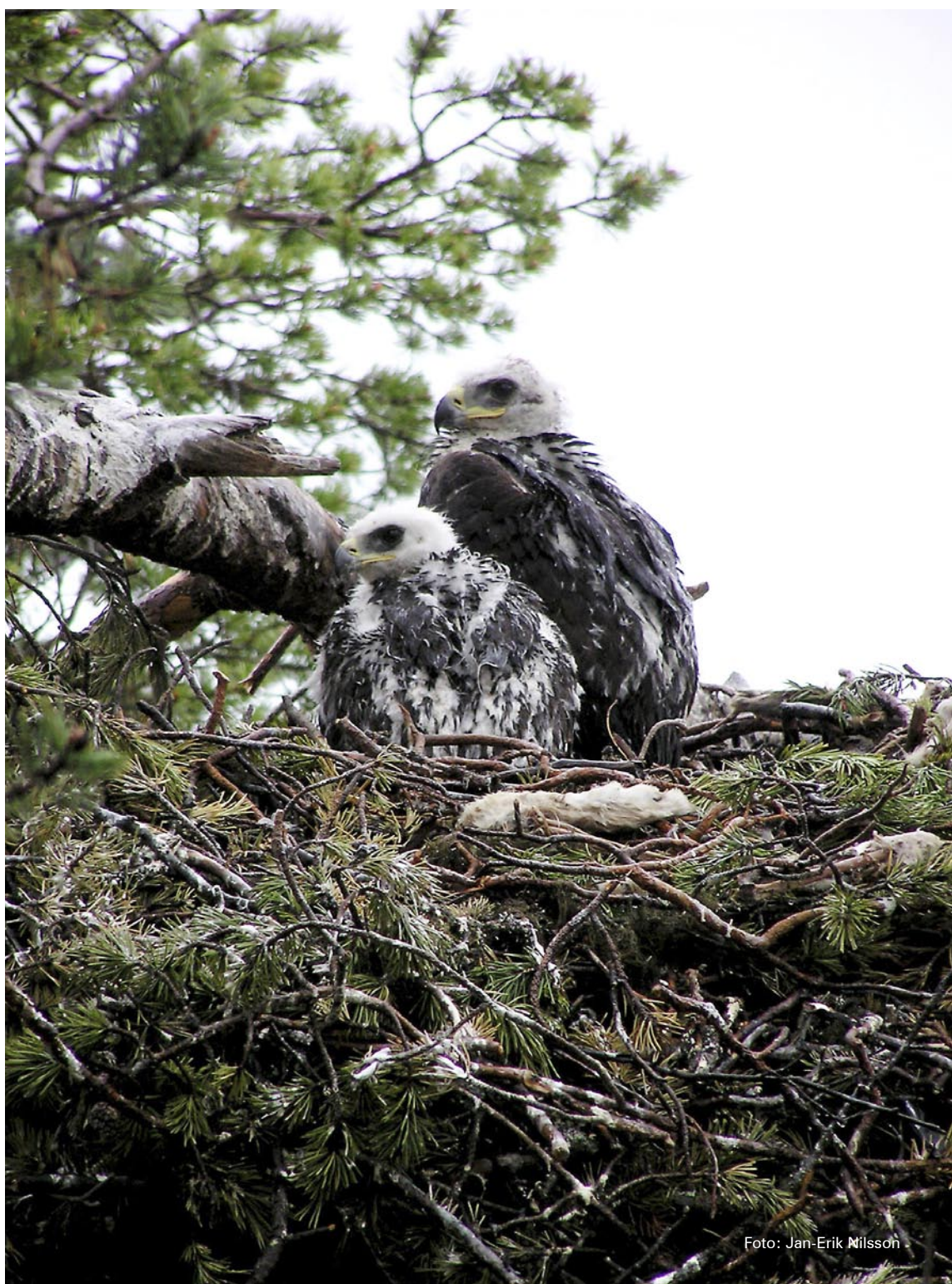
Kungsörnsungar i sitt bo.

De mätta och tunga kungsörnarna blir lätta offer för ett framrusande tåg när de äter på kadaver. Att örnarna kan äta ansenliga mängder vid ett tillfälle visar en ung hona som blev överkörd av tåget i september 2003. Hon vägde 5630 gram och hade 813 gram föda i krävan vilket utgör 15 procent av den totala vikten.