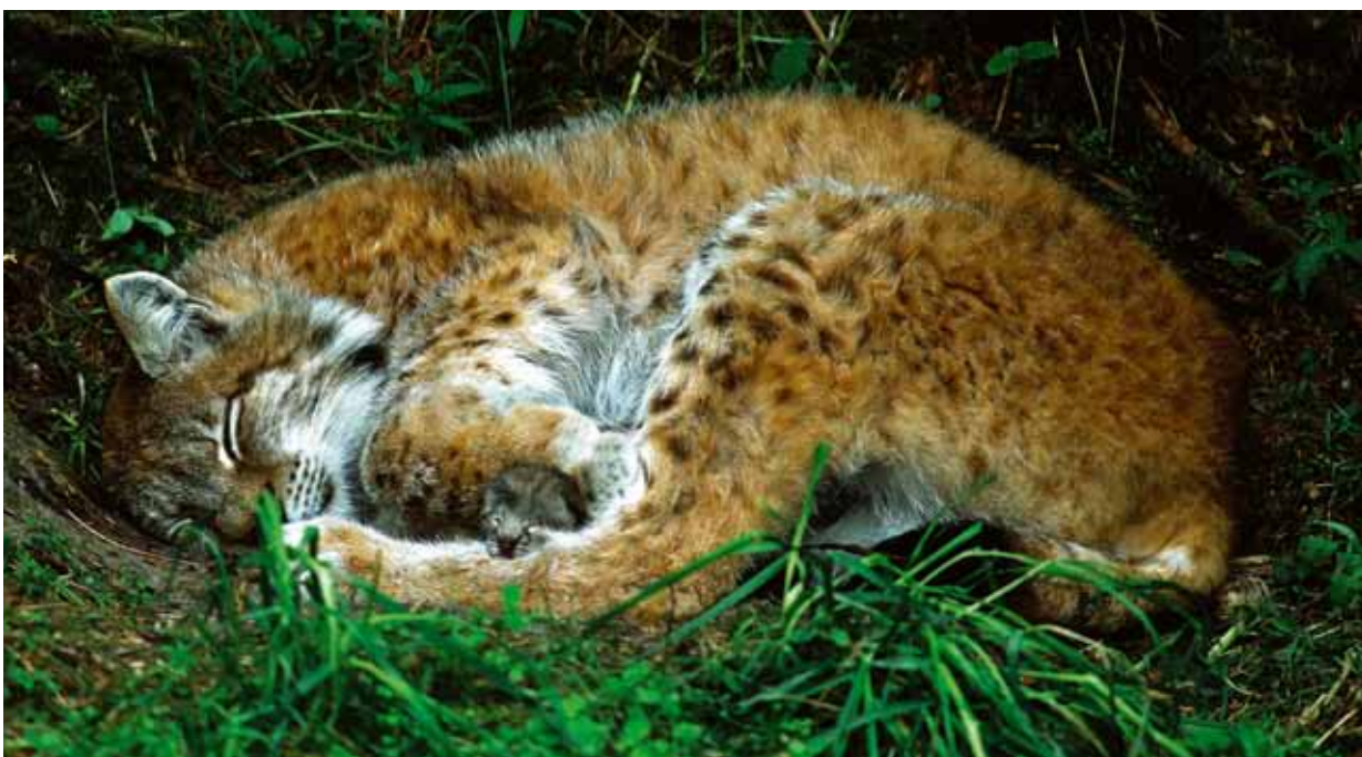
Lodjurshona med nyfödd unge mellan tassarna.