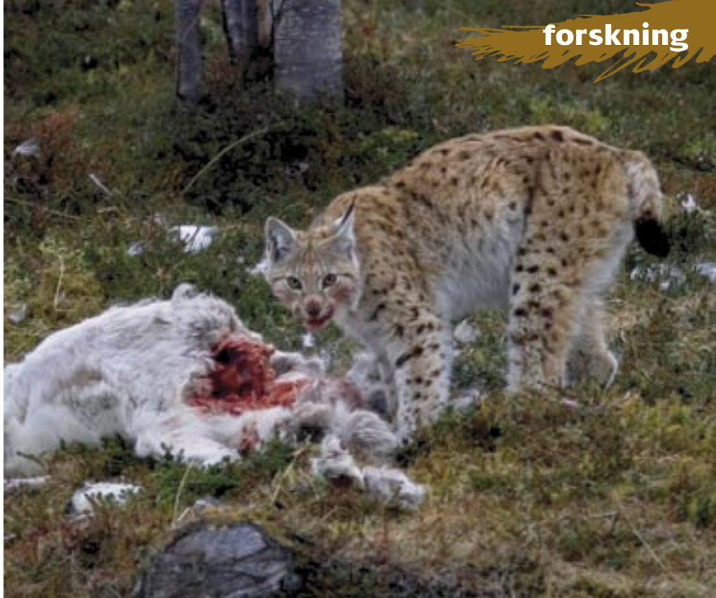
Lodjur på nyslagen ren.

Om järven har möjlighet att skrämja bort lodjuret från dess byte eller konsumerar bety-