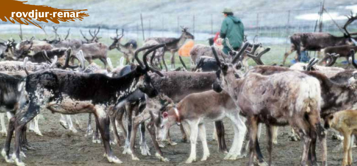
Kalvmärkning vid midsommartid.