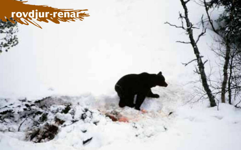
En nyvaken tvåårig björn besöker ett gammalt renkadaver.