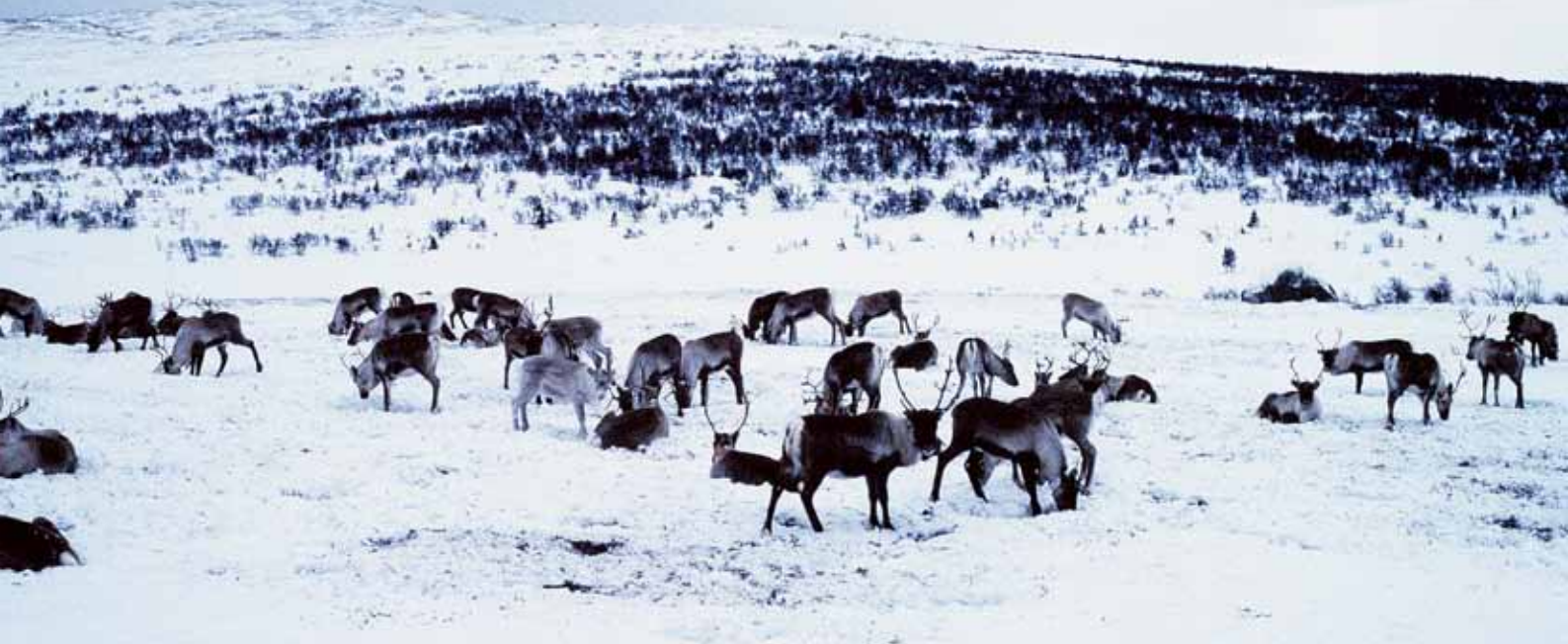
Betande renvajor på vårvintern inför stundande kalvning i maj.

...men utbetalningarna för deras förekomst i renskötselområdet används inte renodlat som syftet var,