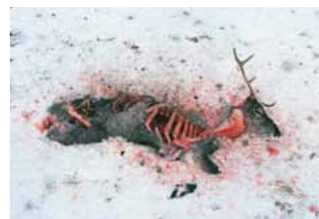
En lodjursdödad renvaja som också ätits av järv, räv, örn och korpar.

• Prästskogen 2014 och 2015. Reviret ligger på gränsen mellan tre län – Gävleborgs-, Västernorrlands- och Jämtlands län. Reviret ligger utanför renskötselområdet såväl enligt Rovbase som de gränser som Sametinget redovisar. Inga vargdödade renar är registrerade i databasen Rovbase. Enligt årsrapporterna föddes valpkullar i reviret både 2014 och 2015. Hanen i paret är en finsk/ryske invandrare (Galvenhanen). (Källor: Inv. av varg vintern 2014-15, Rovdata/VSC nr 1 2015; Inv. av varg vintern 2015-2016, Rovdata/VSC nr 1 2016; Rovbase - publik del. )