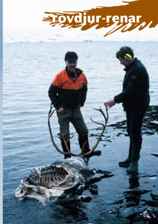
En järvdödad rentjur som tagit sin tillflykt till en tjärn.

lämna bidrag till åtgärder för att förebygga att varg, björn, järv, lo eller kungsörn orsakar skador på renar. Bidrag får lämnas för åtgärder som normalt inte ingår i renskötseln. Samebyarna har varit avvisande till sådana bidrag och menat att andra åtgärder än skydds jakt inte är möjliga att använda i renskötsel arbetet. Antalet bidrag har dock ökat under senare år. 2016 utbetalade Sametinget 722 843 kronor i bidrag fördelat på 15 samebyar i 19 ärenden. De absolut flesta bidragen gäller ersättning för kostnader vid skydds jakt, men i några fall för särskilda åtgärder som utfodring och transporter då vargar uppträder i en sameby.