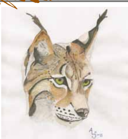
Illustration: Annika Lundin Jonsson

Vandrar ljudlöst i ingenmansland lyssnar till ingens ord, fjärran är minnen från lyckans land -förnimmer väl skugglika löften ibland, från en ljusare, klokare jord.