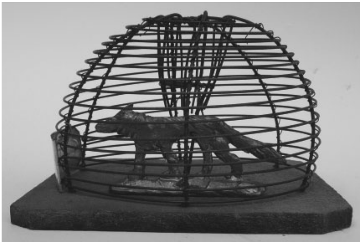
Detalj av "Den store jägaren." Skulptur 1997-98. Material: Gjutjärn, ståltråd, plåt. Storlek: 175 x 106 x 15 cm. Van vid milsvida marker, nu fångad och instängd på minimal yta.