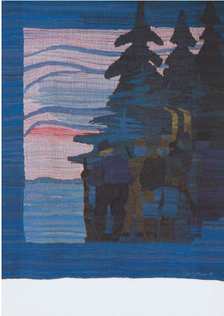
"Vargskall", 4 vävar å 120x150 cm. 1980-81.